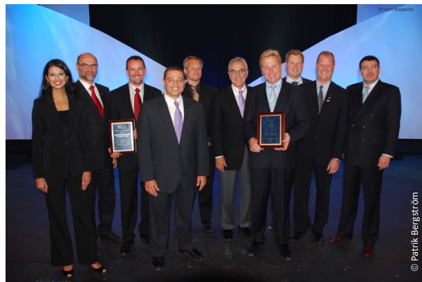
Sweden Chapter tilldelas Chapter of the Year Award vid PMI Global Congress i Denver 2008